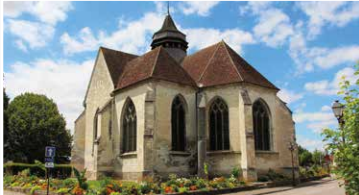
Église XVI e siècle

Visite libre *Samedi et dimanche 10h-12h et 14h-18h