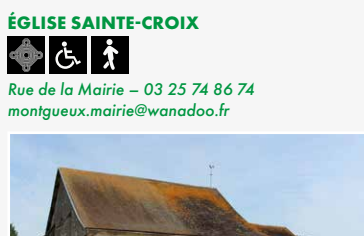
Église XVI e siècle

Visites commentées *Dimanche 14h30-17h30