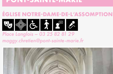
Église XVIII e siècle

CIRCUIT DÉCOUVERTE PATRIMOINE SAVINIEN DU XIX e SIÈCLE