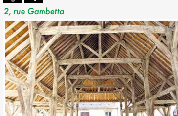
Halle en bois du XVII e siècle