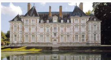
Château XVII e siècle, style Louis XIII

1, rue Dalmat – 03 25 81 24 90 chateau.barberey@orange.fr