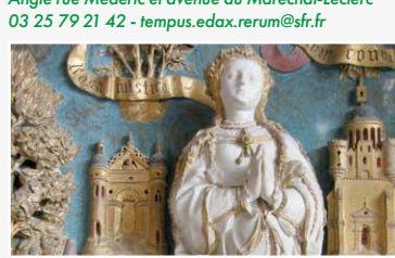
Église XVI e , mobilier remarquable

03 25 79 21 42 - tempus.edax.rerum@fr.fr