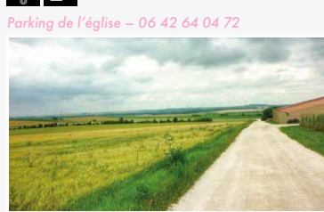
Château XVIII e siècle, style Louis XIII

Visites commentées sur 6,5km, de l'église communale classée Monument Historique à la plaine environnementale, sa flore et sa faune expliquée par une animatrice de la ligue de protection des oiseaux *Samedi 9h